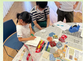
若者の若者による「障害」のない居場所づくり

三宅町やMiiMoでやってみたいこと、 チャレンジしたいことを「初夢」として教えてください！