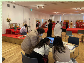
みいもでひな祭り

過去2回で計3つの夢に伴走しました。 MiiMoは、使用料や広報の面で支援しています。 いずれも、現在進行形で行われている取り組みになっています。